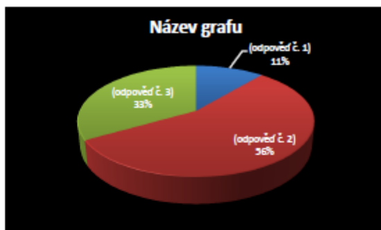
(Graf č. 1 – (název grafu))

V praktické části můžete nalézt spoustu tabulek, grafů a různých textů, které nějakým způsobem vyhodnocují výsledky vaší práce. Zkoumané subjekty mohou být různě tříděny (rozdělení lidí v kolektivu), záleží pouze na vašem pojetí. Tyto data mají za úkol zjištění pravdivosti a přitom by měly stavět na daných základech.