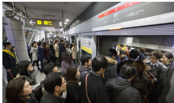
A naopak pokud se vydáte v pátek večer :D

Zatímco MHD je procházka růžovým sadem, meziměstská doprava už tak lehká není. Většina aplikací a dopravců bere jen Korejské karty a mají rezervační portály pouze v korejštině. Jediná společnost mající anglickou verzi aplikace, která bere zahraniční karty je Korail, který vypravuje vlaky KTX, ITX a Mugunghwa. Pomocí nich se ale dá dostat kdekoliv po Koreji, takže není problém a doporučuji používat pouze vlaky Korail, stačí stáhnout aplikaci, vybrat jízdenku, zaplatit kartou a pak jen nastoupit, jízdenku ukážete v aplikaci (ale nikdo ji vidět chtít stejně nebude). KTX je nejdražší a nejrychlejší vlak, v některých úsecích jezdí až 350 km/h a zaléhají z toho uši – cena jízdenky přes celou Koreu Seoul->Busan trvá pouze 5 hodin a stojí kolem 1200,-