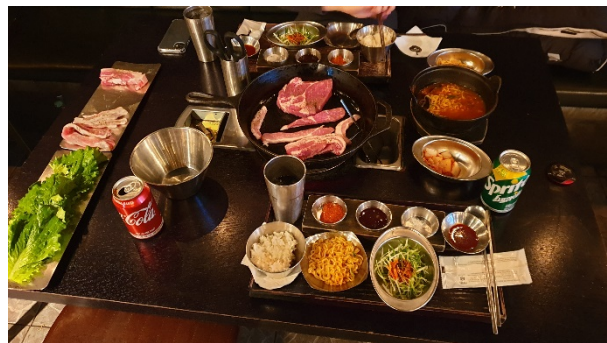
Korejské BBQ, All-you-can-eat, nekonečné množství masa, vše za 240 Kč

Lze samozřejmě najít i restaurace se západním jídelm, je třeba ale počítat s vysokou cenou. Pokud jíte jako Korejci, lze se najíst velmi levně a to i levněji a lépe než v ČR, jídlo je jedna z nejlepších věcí na Koreji. Pokud trváte na západní stravě, musíte šáhnout hluboko do kapsy. Pokud chcete navštívit třeba českou restauraci, je třeba si připravit 600 Kč za guláš se 3 knedlíky, nebo 700 Kč za svíčkovou. Podobné jsou ceny všech evropských kuchyní.