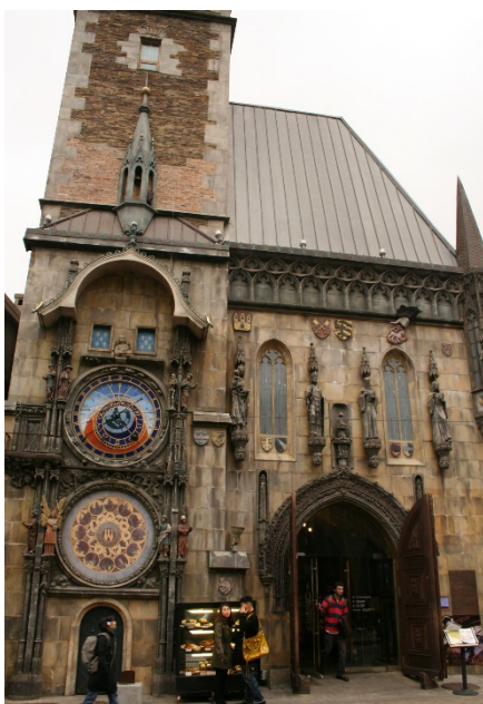
Česká restaurace v Seoulu

Lze samozřejmě najít i restaurace se západním jídelm, je třeba ale počítat s vysokou cenou. Pokud jíte jako Korejci, lze se najíst velmi levně a to i levněji a lépe než v ČR, jídlo je jedna z nejlepších věcí na Koreji. Pokud trváte na západní stravě, musíte šáhnout hluboko do kapsy. Pokud chcete navštívit třeba českou restauraci, je třeba si připravit 600 Kč za guláš se 3 knedlíky, nebo 700 Kč za svíčkovou. Podobné jsou ceny všech evropských kuchyní.