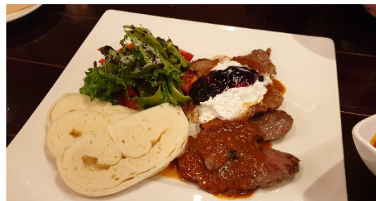
„Svíčková“ za 700 Kč