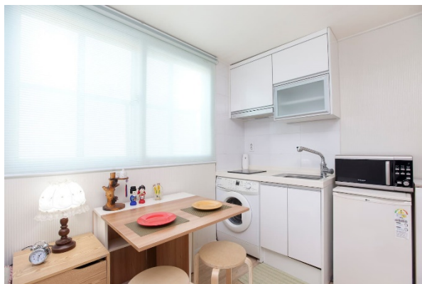
Airbnb nabídlo rozhodně lepší ubytování než koleje