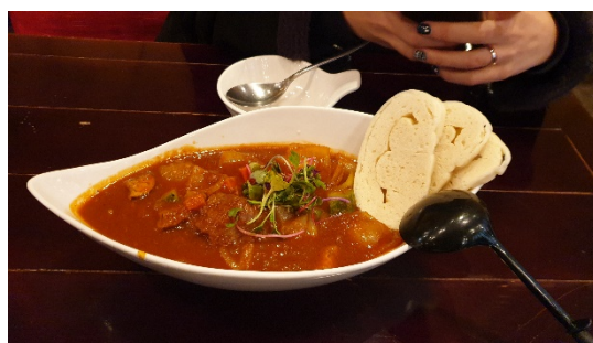
Guláš za 600 Kč