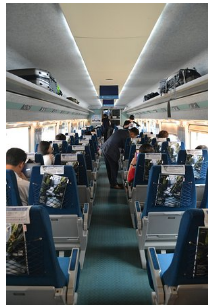
Vlaky jsou velmi moderní a pohodlné, lze projet celou Koreu

Zatímco MHD je procházka růžovým sadem, meziměstská doprava už tak lehká není. Většina aplikací a dopravců bere jen Korejské karty a mají rezervační portály pouze v korejštině. Jediná společnost mající anglickou verzi aplikace, která bere zahraniční karty je Korail, který vypravuje vlaky KTX, ITX a Mugunghwa. Pomocí nich se ale dá dostat kdekoliv po Koreji, takže není problém a doporučuji používat pouze vlaky Korail, stačí stáhnout aplikaci, vybrat jízdenku, zaplatit kartou a pak jen nastoupit, jízdenku ukážete v aplikaci (ale nikdo ji vidět chtít stejně nebude). KTX je nejdražší a nejrychlejší vlak, v některých úsecích jezdí až 350 km/h a zaléhají z toho uši – cena jízdenky přes celou Koreu Seoul->Busan trvá pouze 5 hodin a stojí kolem 1200,-