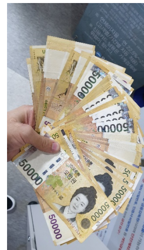
2 miliony wonů v hotovosti

Celkem mě 7 měsíční pobyt stál kolem 233 000,- Kč. Pokud bych pobyt podstoupil pouze sám, tak bych za něj dal odhadem 60% této částky, tedy nějakých 140 000, a to je částka při