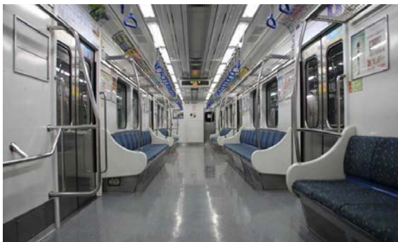
Pokud si na cestu metrem přivstanete...

Jakmile máte kartu, lze používat jakékoliv metro i bus, kartička se pípá při nástupu i výstupu. Při přestupu je sleva popř. je přestup i zdarma, a to včetně kombinace metro/bus. Cena jízdenky je většinou 1250₩.