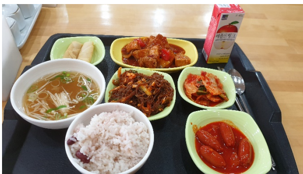
Typické jídlo z jídelny za 80 Kč

Restaurací kolem kampusu je spousta, ostatně jako všude v Koreji a jídlo je velmi levné, většinou za 5000 – 8000₩, velmi kvalitní a jsou ho poctivé velké porce. Je třeba ale počítat s tím, že obsluha neumí anglicky, vše je v korejštině a ne všechny restaurace mají menu s obrázky. Doporučuji udělat si Korejské kamarády a nechat se provést.