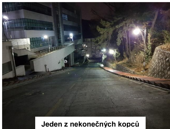
Jeden z nekonečných kopců

Sangmyung University se na nachází téměř v srdci Soulu – pouhých 10 minut autobusem od Gyeongbokgung paláce. Kampus se nám zdál obrovský, ale samotní studenti ho označili jako malinký. Nachází se tam několik budov pojmenovaných písmenky, knihovna (ve které jsme nemohly dohledat anglické texty), 2 convenient stores (7-Eleven a GS25 – otevřené 24/7/365). První den jsme dostaly mapu, takže je dobré ze začátku ji