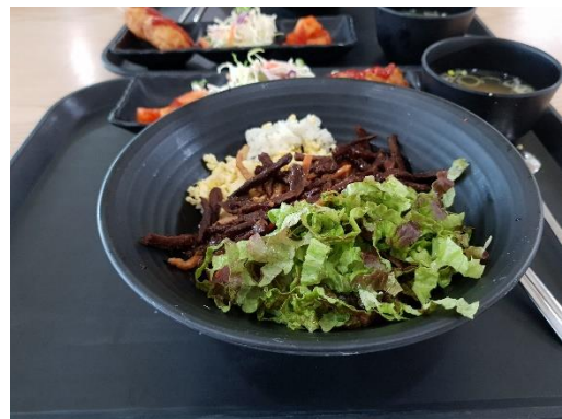
Slušné i zdravé jídlo z menzy

Samozřejmě, se tam nachází i menza , která vaří slušně za slušné ceny. Je na výběr mezi 2 jídlí. Ceny v rozmezí od $4 - $4,5 a pokud nemáte chuť na jídlo z menzy, podél toho obrovského kopce je tak tucet restaurací. Stačí si jen vybrat. Ceny už jsou pak o něco vyšší. (cca o $3 - $4).