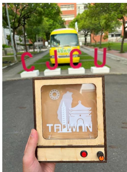
HOTOVÝ LED BOX S IMPLEMENTOVANÝM SVÍTÍCÍM PÁSKEM