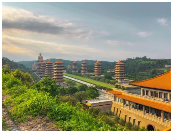
Fo Guang Shan Monastery - Taiwan