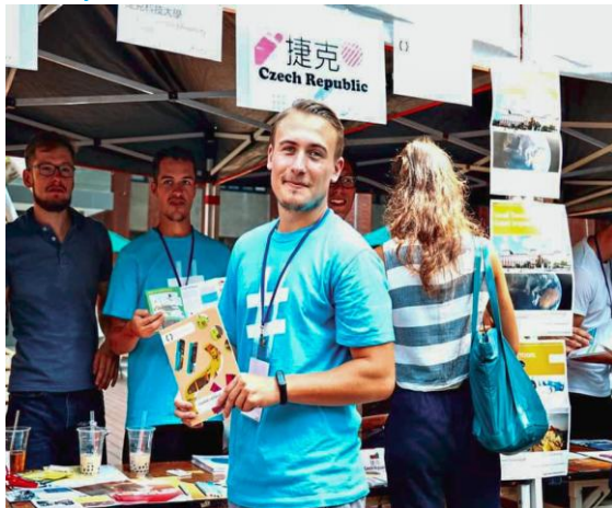
Reprezentace UHK na veletrhu partnerských škol