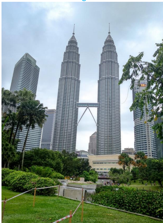
Petronas Twin Towers – KL – Malajsie