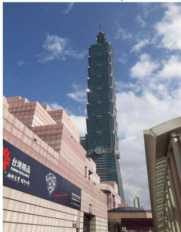
Taipei 101 Tower