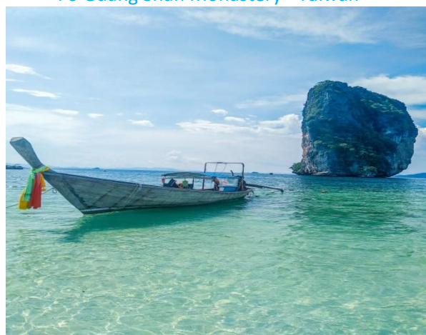
Poda Island - Thajsko