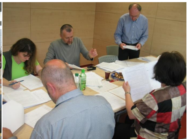
Zkoušky, testování, hodnocení, učebna budovy FIM