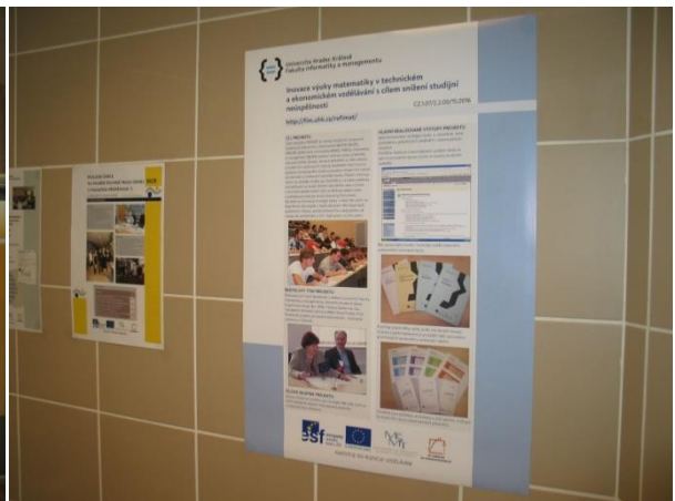
Akce Tvořivá univerzita, Den projektů, březen 2013, atrium objektu společné výuky