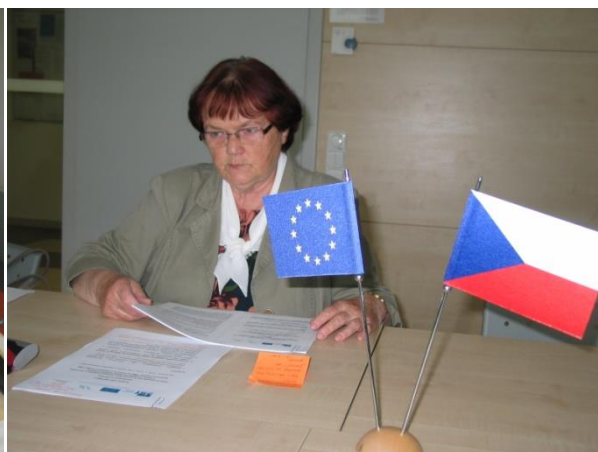
Jedna z porad řešitelů