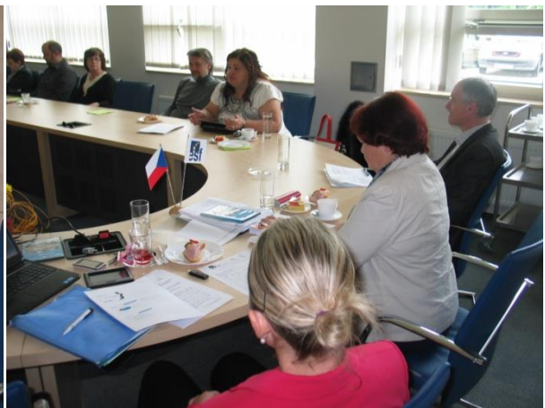
Závěrečný workshop, květen 2013, zasedací místnost FIM UHK