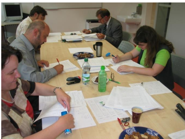
Zkoušky, testování, hodnocení