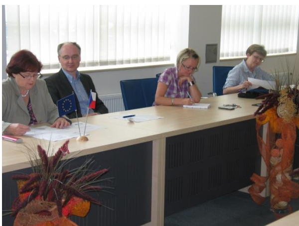
Jedna z porad řešitelů, zasedací místnost FIM UHK