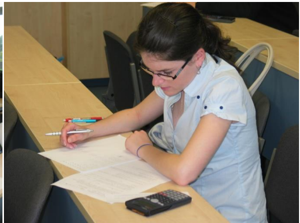
Zkoušky, testování, učebna budovy FIM