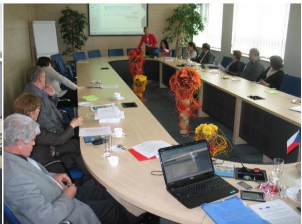
Závěrečný workshop, květen 2013, zasedací místnost FIM UHK