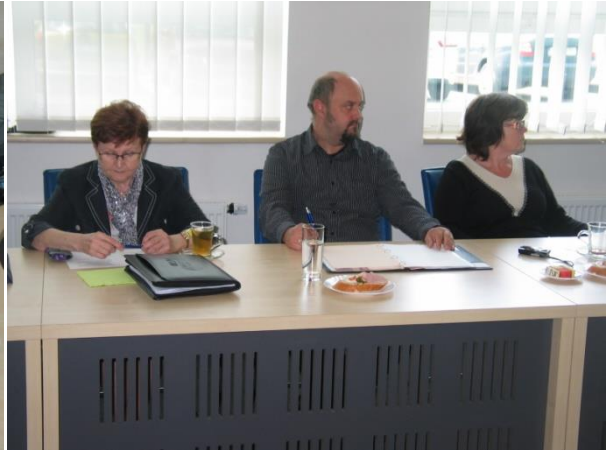
Závěrečný workshop, květen 2013, zasedací místnost FIM UHK