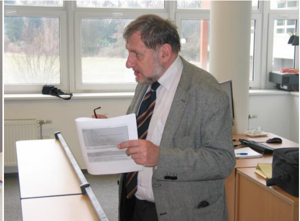
Průběh hlasování, podklady otázek