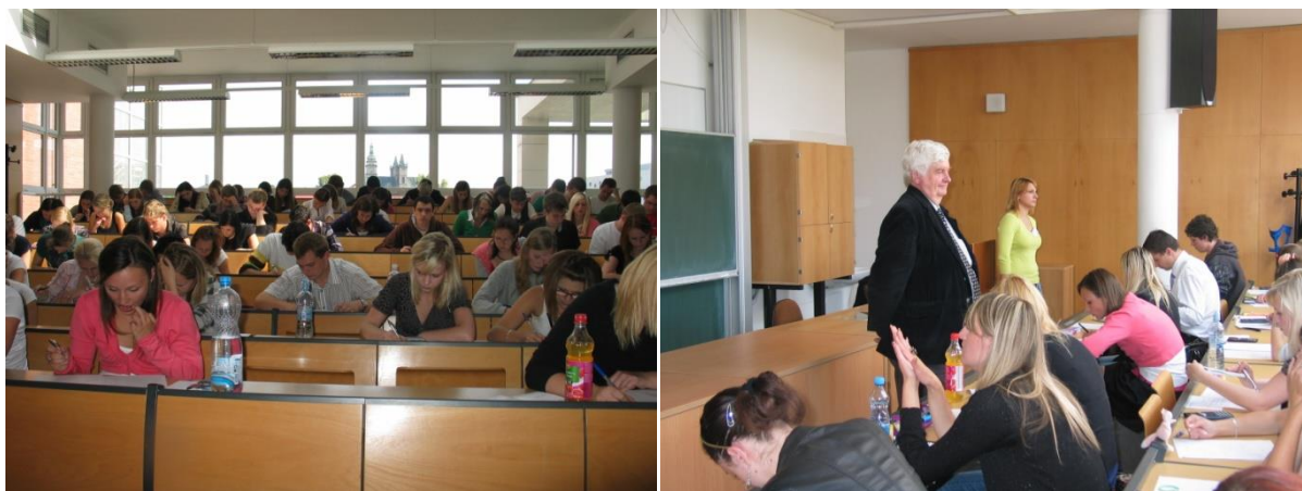
Přijímací řízení, testy z matematiky, učebna v objektu společné výuky