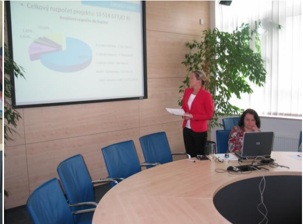
Závěrečný workshop, květen 2013, zasedací místnost FIM UHK